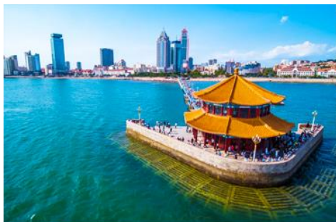
สะพานจ้านเฉียว