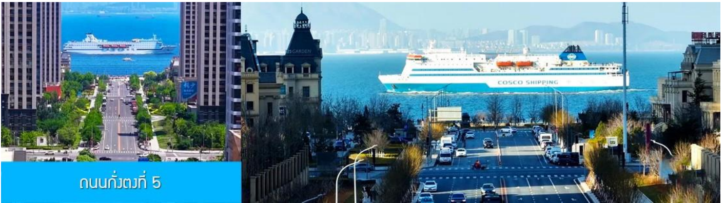
ถนนกั๋วตงที่ 5

หลังอาหารนำท่านเที่ยวชม ถนนกั๋วตงที่ 5 港东五街 จุดเช็คอินใหม่ที่ได้ได้รับความนิยมอย่างสูงจากนักท่องเที่ยวและชาวเมืองต้าเหลียน จุดนี้เป็นช่วงที่ถนนสายกั๋วตงที่ห้า มุ่งตรงสู่ทะเล(มองจากจุดชมวิวที่อยู่ด้านบน) เสมือนว่าปลายทางของถนนไปสิ้นสุดในทะเล อีกด้านจะมองเห็นท่าเรือและอาคารสถาปัตยกรรมตะวันตกเป็นกรอบของมุมมองที่งดงาม เมื่อมีเรือแล่นมาผ่านทะเลตรงบริเวณนี้ จะเป็นภาพที่สวยงามและโรแมนติก