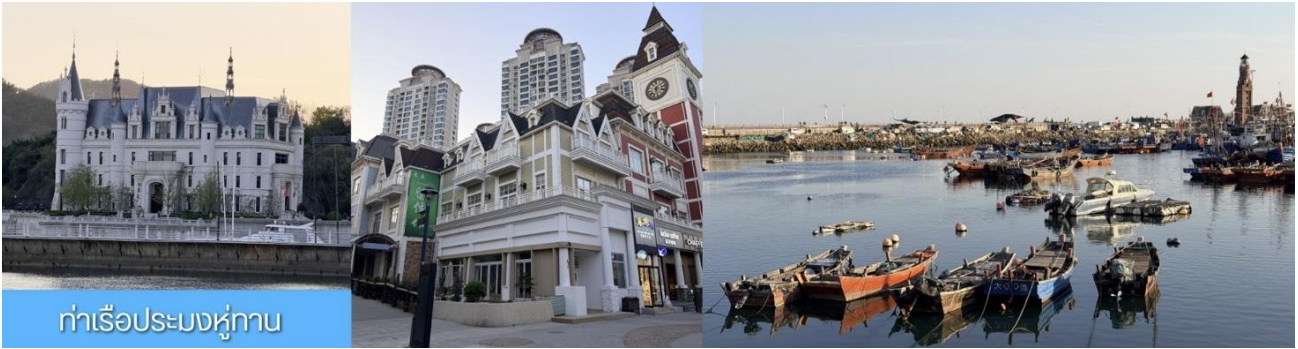
ท่าเรือประมงหู่กาน

วันที่สาม เมืองต้าเหลียน- ท่าเรือประมงหู่กาน- อ่าวหลิงเจี้ยว- พิพิธภัณฑ์ต้าเหลียน-ถนนกั๋งตงที่ 5- เมืองเวนิสตะวันออก-ไกด์ขายออฟชั่นนั่งเรือให้อาหารนก -ท่าเรือต้าเหลียน-เยินไถ (พักค้างคืนบนเรือ)