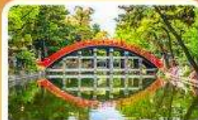
ศาลเจ้าสุมิโยชิ โกเบ