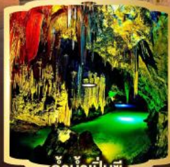
ถ้ำน้ำเป็นซี