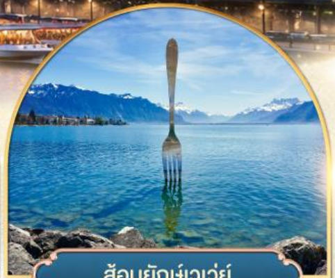
ล้อมยึกเขาวัว