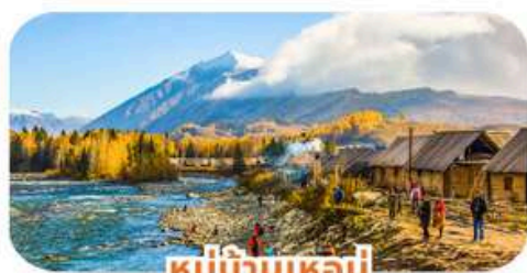
หมู่บ้านเหมอู๋