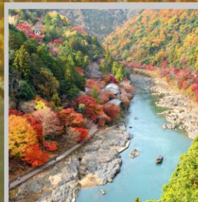
“ARASHIYAMA MT. KAMEYAMA”