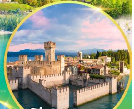
ซิริมิโอเน