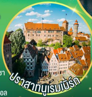
ปราสาทนูเรนเบิร์ก