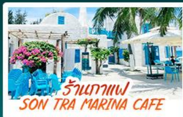
ร้านกาแฟ SON TRA MARINA CAFE