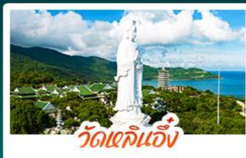
วัดเขลิ้นงู