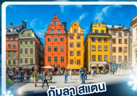
กับลาฮาน