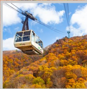
“ZAO CHUO ROPEWAY”