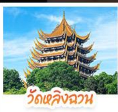
วัดหลิงฉวน