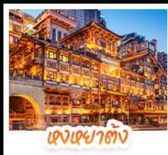
แสงสถาปัตย์