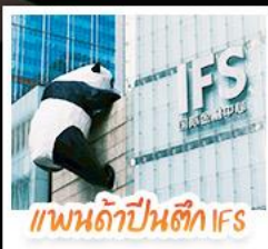
แพนด้าปาร์ค IFS