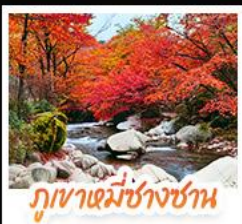
ภูเขาหมี่ซางชาน