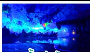
ถ้ำคู่อ้อ

เขารู้อี+สะพานแดง - ล่องเรือแม่น้ำหลี่เจียง นาขั้นบันไดสีทองอร่าม - กำแพงสุ่ยอ้อ - ทางวงช้าง เจดีย์เงินเจดีย์ทอง - รถไฟความเร็วสูง เมฆพิเศษ บุปผาฟ้าย่างบาร์บีคิว ปลาอบเบียร์ เผือกคริสตัล สุกี่เห็น