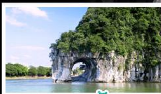
ทางวงช้าง