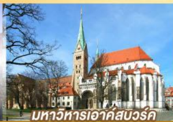
มหาวิหารเอาก์สบวร์ค