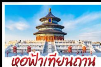
เจดีย์เทียนถาน