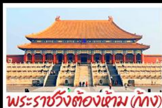
พระราชวังต้องห้าม (ปักกิ่ง)