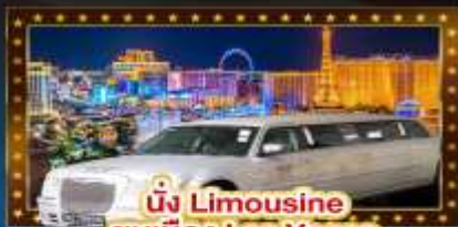
นั่ง Limousine ชมเมือง Las Vegas