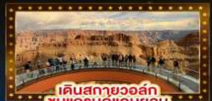
เดินสกายวอล์ก ชมแกรนด์แคนยอน