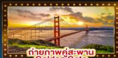
ถ่ายภาพคู่สะพาน Golden Gate