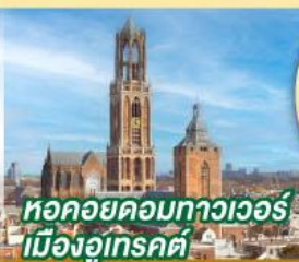
หอคอยดอกทิวลิปเมืองอูเทรคต์