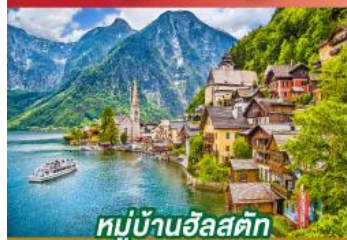
หมู่บ้านฮัลล์สตัดท์