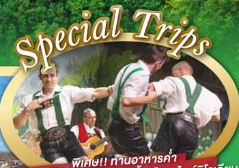
พิเศษ!! ทานอาหารค่ำ พร้อมชมการแสดงดนตรีพื้นเมืองสไตร์ทิวเลียน และเยือนเมืองอูเทรคต์ สีสันใหม่เนเธอร์แลนด์