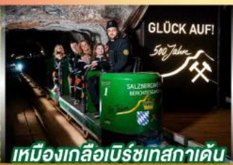
เหมืองเกลือเบิร์ชเทสกาเดิน