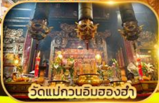
วัดแม่กวนอิมของฮ่า