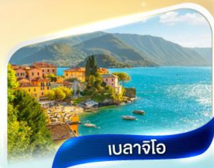
เบลาจีโอ