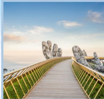
สะพานมือทองคำ