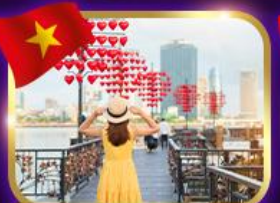
เซ็คอินสะพานแห่งความรัก