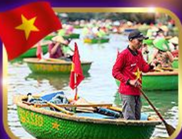
เรือกระด้ง หมู่บ้านกิมทาน