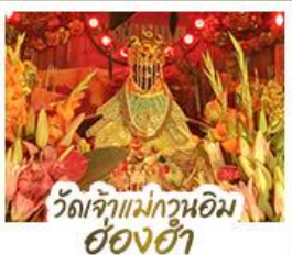
วัดเจ้าแม่กวนอิมอ่องฮ่า