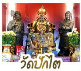
วัดป๊กโต