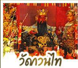
วัดกวนน้้ไท