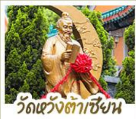
วัดเว้งต้าเซ็ง