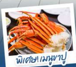
พิซซ่าเมมูซาปู