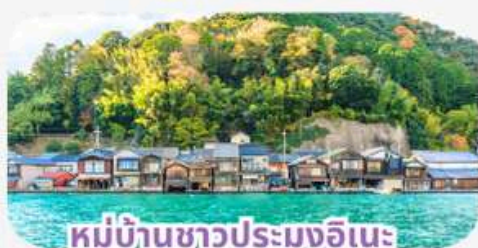
หมู่บ้านชาวประมงอินะ