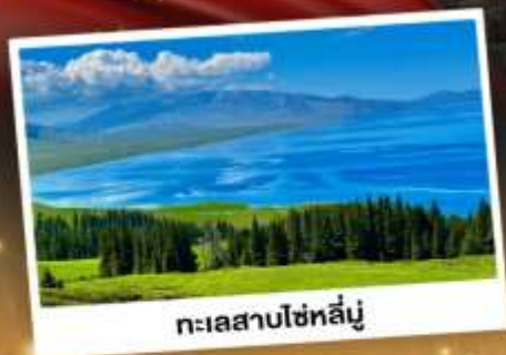
ทะเลสาบไซทาลี

ชมวิวดอกคังการแบบยุโรปผสมเอเชีย กุ้งหนุ่ยานาราตี ทะเลสาบสีเทอร์ควอยซ์