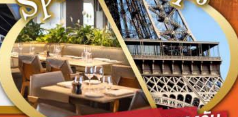
รับประทานอาหารกลางวันบนหอคอไอเฟล

ไฮไลท์ในโปรแกรม • สะพานไม้ชาเปล ลูเซิร์น