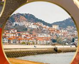
ซาจี้โข่ว