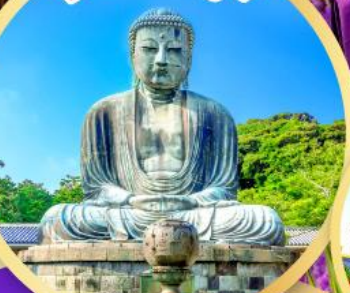
หลวงพ่อโต ไคบุคุสึ

เช็คอิน จุดถ่ายรูปมุมมองใหม่ วัดโทเชคิจิ