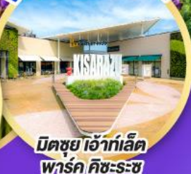
มิตซูเอะอิเกะอิชิ พาร์ค คิชะระชู