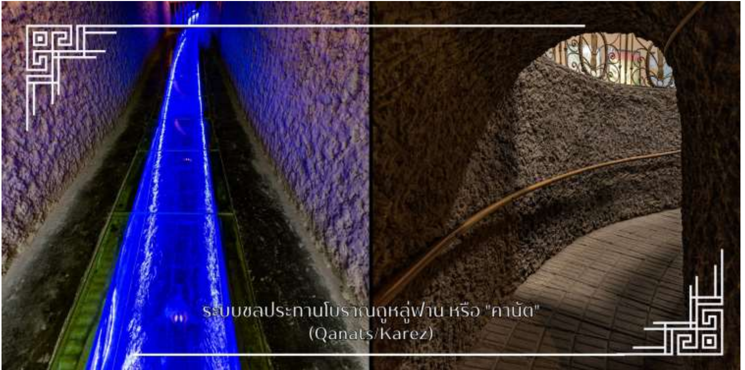
ระบบชลประทานโบราณถูลู่ฟาน หรือ "คานัต" (Qanats/Karez)

ระบบชลประทานโบราณถูลู่ฟาน หรือ “คานัต” เป็นระบบส่งน้ำใต้ดิน ในเขตซินเจียง ประเทศจีน ใช้ภูมิปัญญาชุดอุโมงค์ ใต้ดินเชื่อมต่อกัน เพื่อนำน้ำจากหิมะละลายบนภูเขามาใช้ในโอเอซิสทะเลทราย ลดการระเหยของน้ำ ทำให้เมืองถูลู่ฟาน อุดมสมบูรณ์และเป็นแหล่งปลูกองุ่นขึ้นชื่อ