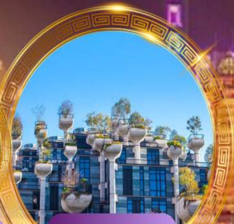
Tian An 1,000 Trees