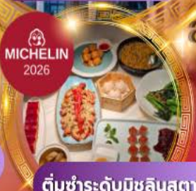
ติ่มซำระดับมิชลินสตาร์