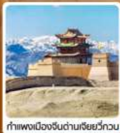
กำแพงเมืองจีนด่านเจี๋ยวี่กวน