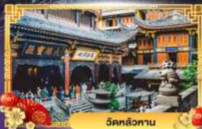
วัดหลิวหนาน