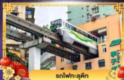
รถไฟฟ้า-ลูตึก