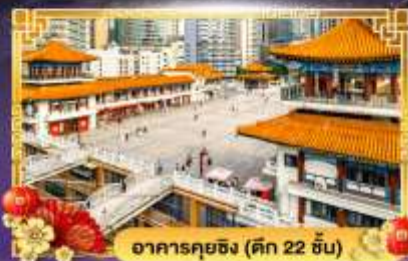
อาคารคฤขิง (ตึก 22 ชั้น)