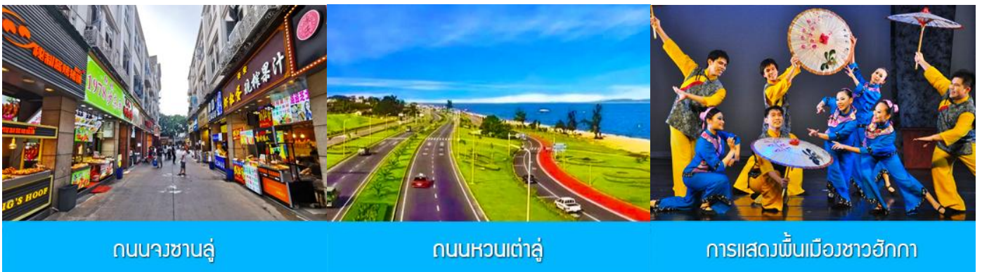
ถนนวซาลู่

พักที่ โรงแรม XIAMEN HENGLONG HOTEL 4* หรือเทียบเท่าในเมืองเซี่ยะเหมิน