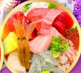
ตลาดปลาชิมาอิชิ คาชิโนะอิชิ