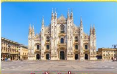
ซอปป์ิงจู่ที่มีลาน