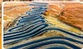
ถนนผานหลงกู่ต้าอว