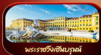
พระราชวังเซินบรูน์