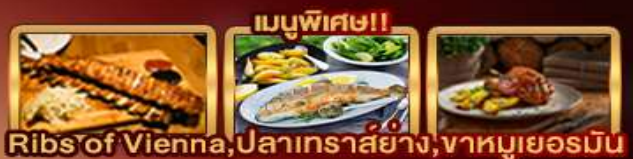
Ribs of Vienna, ปลาเทราสย่าง, ฆาตกรรมเยอรมัน

Zugspitze Munich Salzburg Hallstatt Bratislava