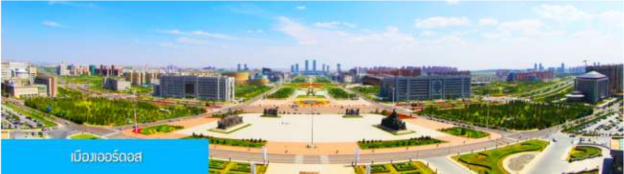
เมืองออร์ดอส