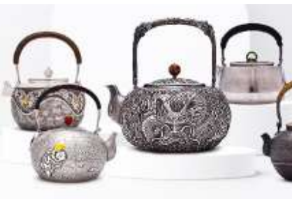
พิพิธภัณฑ์เครื่องเงินบอโกล