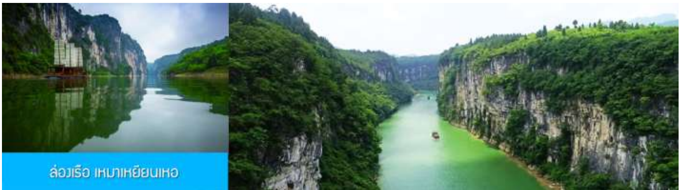
ล่องเรือ เหมาหยินเหอ