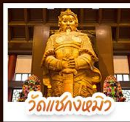
วัดเชกโงเมว