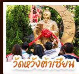
วัดเซว้งต่าเซ็ง