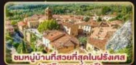
ชมหมู่บ้านที่สวยงามที่สุดในฝรั่งเศส (มูสดีเยแซงมาร์)