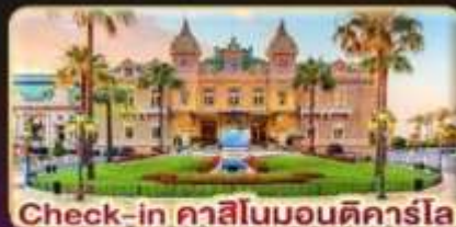
Check-in คาสีโนมอนติคาร์โล