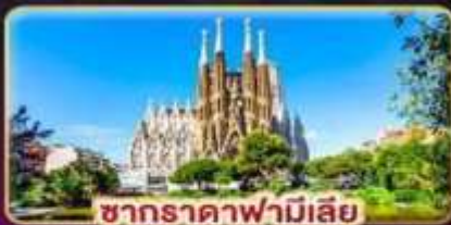
ซากราดาฟามีเลีย