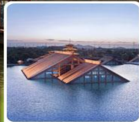
พิพิธภัณฑ์ไดโนเสาร์ กวางฟู่หลิน