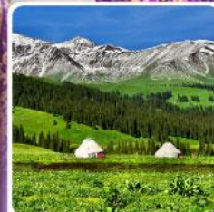
ทุ่งหญ้านาลาตี