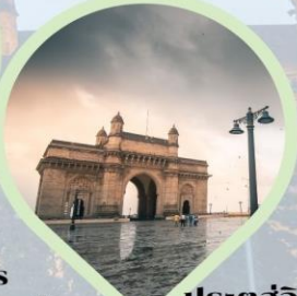
ประตูสู่อินเดีย (Gateway of India) อ่าวมุมไบ Arabian Sea India