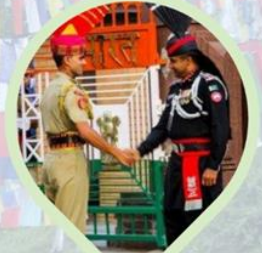
พิธีลดธงพระแดน อินเดีย-ปากีสถาน ชายแดนวากา (Wagah border)