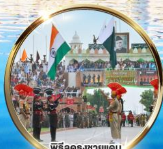
พิธีลดธงชัยแดน อินเดีย-ปากีสถาน ผ่านวาทะห์