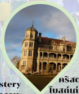
คริสตจักรนีโอโกธิค โบสถ์เก่าแก่ รัฐหิมาจัล