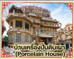
บ้านเครื่องปั้นดินเผา (Porcelain House)