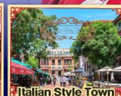
Italian Style Town