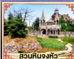
สวนหินจงหลิว