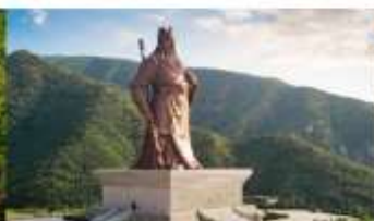
บ้านเกิดกวนอู