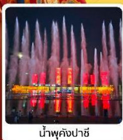
น้ำพุคังปาสี

• โอโหล้ เป็นทรายสีงาช้าง แหล่งท่องเที่ยวระดับ 5A ของจีน ภูเขาไฟอูลันฮาตา น้ำพุคังปาสี น้ำพุที่สูงที่สุดในเอเชีย