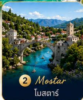
2 Mostar โมสตาร์