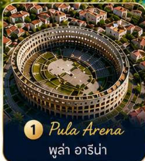
1 Pula Arena ปูลา อารีนา