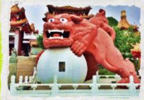
วัดเขวียนหวู