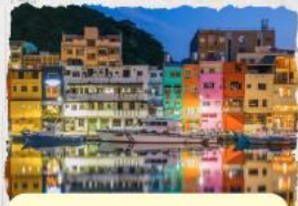
ทะเลสุริยขึ้นฉันทรา