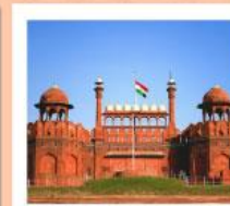
♥♦♦ Agra Fort